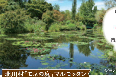
北川村「モネの庭」マルモッタン

大人 75,000円 税込 ■2名1室利用 | 3名1室利用 1人1,000円引き 4名1室利用 1人2,000円引き