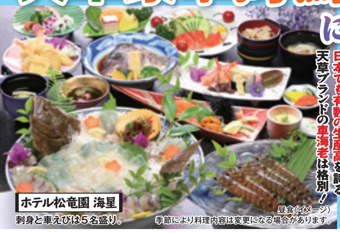
ホテル松竜園 海星