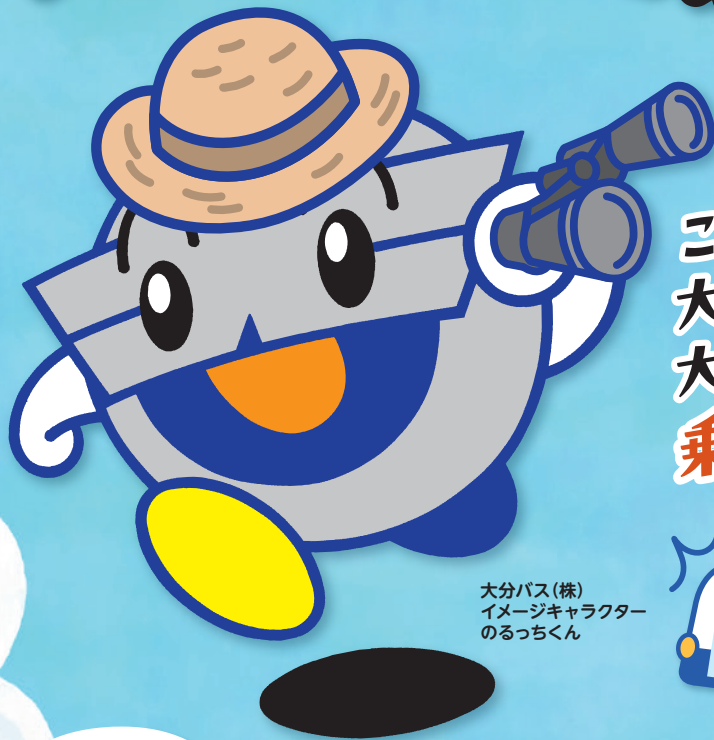
大分バス(株) イメージキャラクター のるっちくん