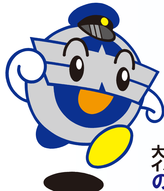
大分バス イメージキャラクター のるっくん